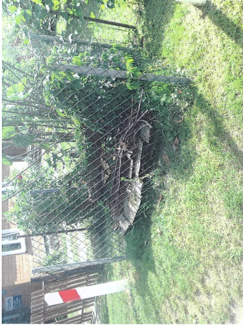
Widok od strony północnej

7. Fotografia z opisem wskazującym orientację w stosunku do sąsiednich terenów lub stron świata albo mapa z zaznaczonym stanowiskiem archeologicznym